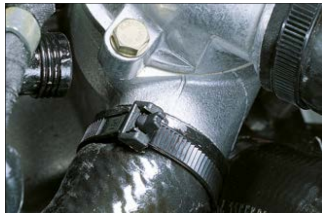
1-teiliger Befestigungsbinder RI160.