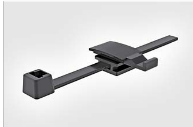
2-teiliger Befestigungsbinder T50RYCCA mit Steckeraufnahme.