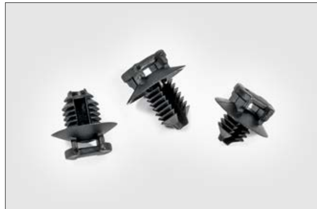
Befestigungselemente für automatisches Bündeln.