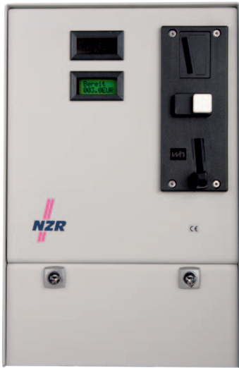
Abb. enthält eingebaute Option O