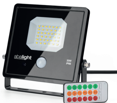
(MILU mit Bewegungssensor)