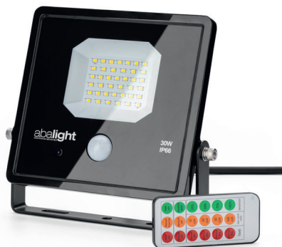
(MILU mit Bewegungssensor)