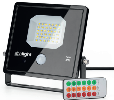
(MILU mit Bewegungssensor)