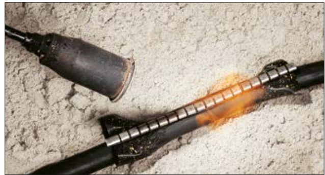
Kabelreparaturmanschetten RMS - für die schnelle und sichere Reparatur vor Ort.