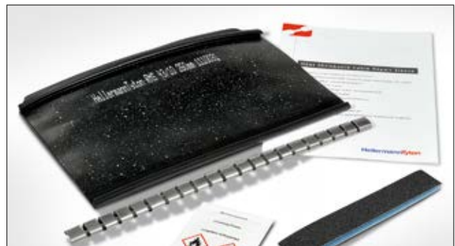
Lieferumfang: Kabelreparaturmanschette, Verschlusschiene, Reinigungstuch, Schmirgelleine, Montageanleitung.