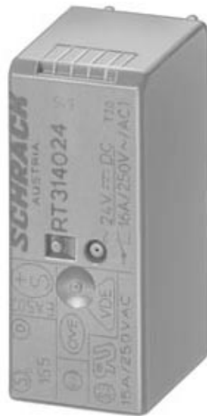
STECKRELAIS, 2 WECHSLER, 24V AC, 8A, BREITE 15,5MM, AUCH FUER LZS-SOCKEL