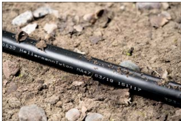
MA47 ist auf und unter der Erde einsetzbar.