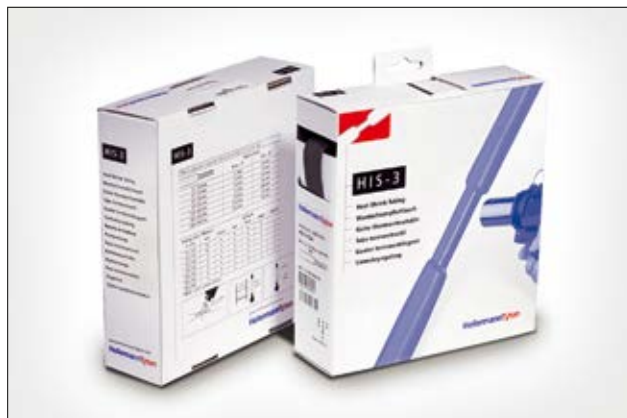
HIS-3 ist selbst bei großen Durchmesserunterschieden geeignet.