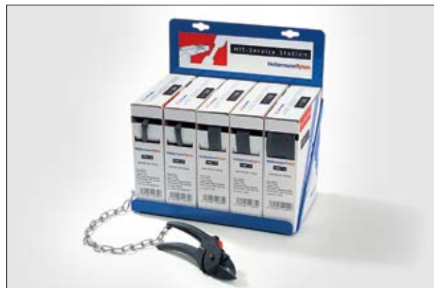
Alles zur Hand in der HIS-Service Station, komplett mit Spezialschere.