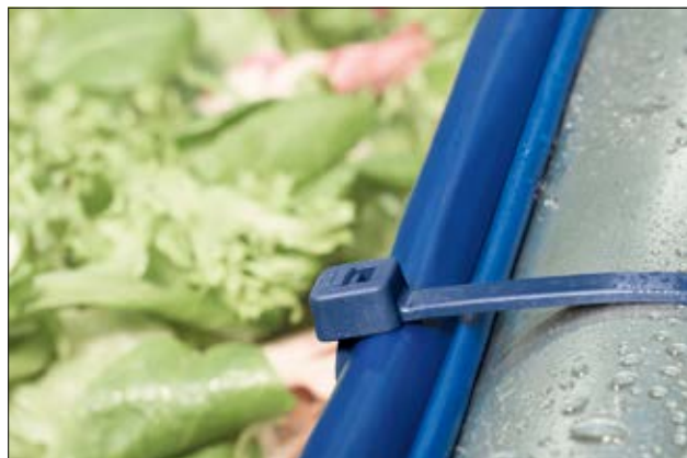
Unsere MCT(S) Kabelbinder zum Einsatz in der Lebensmittel- und Pharma-Industrie.