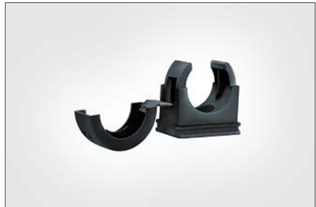
HelaGuard PACC Befestigungsschelle.